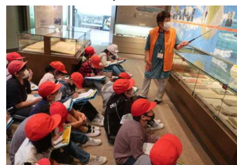
4年・鎌田三之助展示室