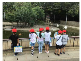
1年・八木山動物公園