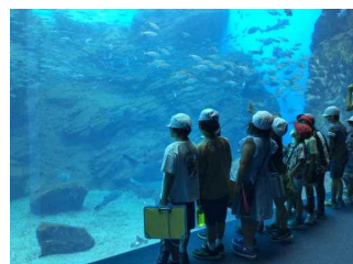
2年・うみの杜水族館